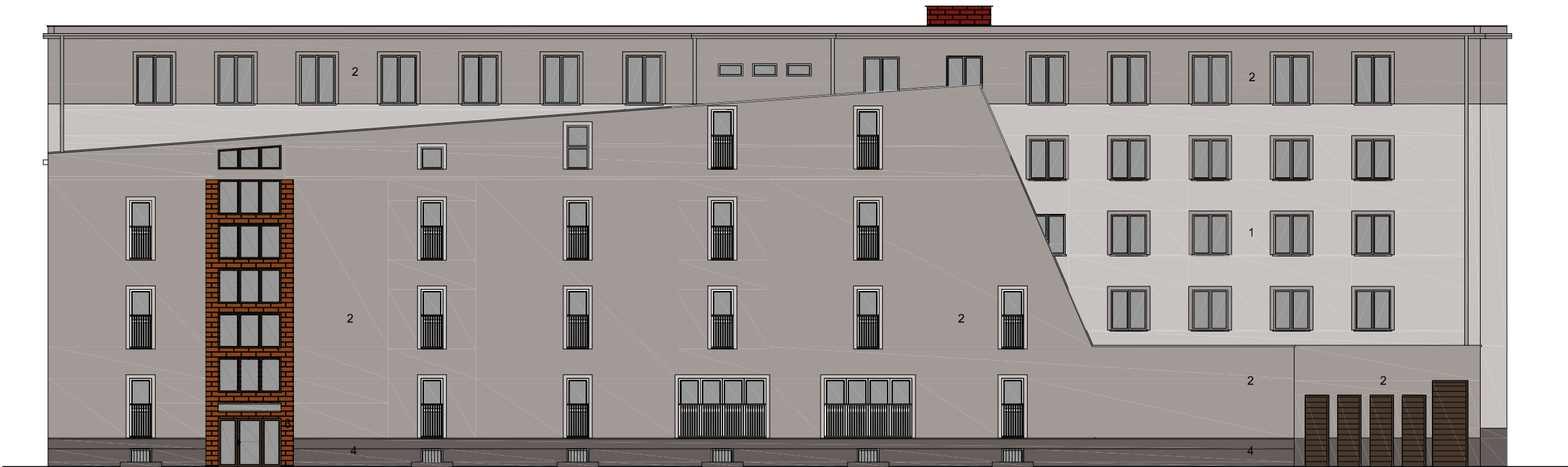
ELEWACJA B WSCHODNIA