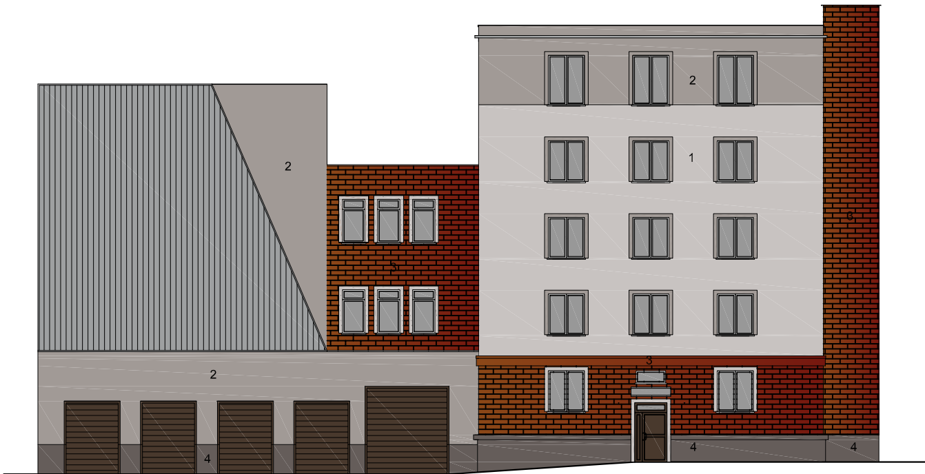
ELEWACJA A PÓLNOČNA