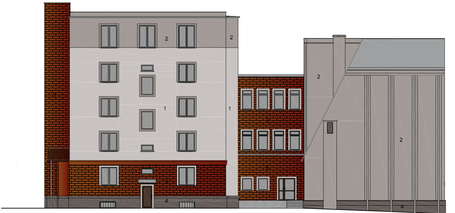
ELEWACJA C POŁUDNIOWA